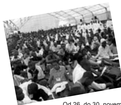
Od 26. do 30. novembra 2008 sa v Nairobi stretlo 7000 mladých ľudí z mnohých oblastí Kene a z iných krajín.

Toto stretnutie, ktoré je zastávkou na púti dôvery organizovanou Komunitou z Taizé, bolo prijaté v 80 farnostiach a cirkevných zboroch rôznych cirkví mesta Nairobi. Cieľom stretnutia bolo prispieť k budovaniu bratskejších vzťahov a vymaneniu sa z nepravdivých predstáv o druhých, ktoré sú živé nedostatkom kontaktov medzi národmi a zraneniami z minulosti. Komunita z Taizé je už 55 rokov prítomná na africkom kontinente v malých fraternitách bratov, ktorí zdieľajú život tých najchudobnejších. Počas minulých rokov žili bratia v Alžírsku, na Pobreží slonoviny, v Nigeri, v Rwande a v Keni. Teraz sú bratia už 16 rokov v Senegale, v štvrti Dakaru s prevahou moslimských obyvateľov.